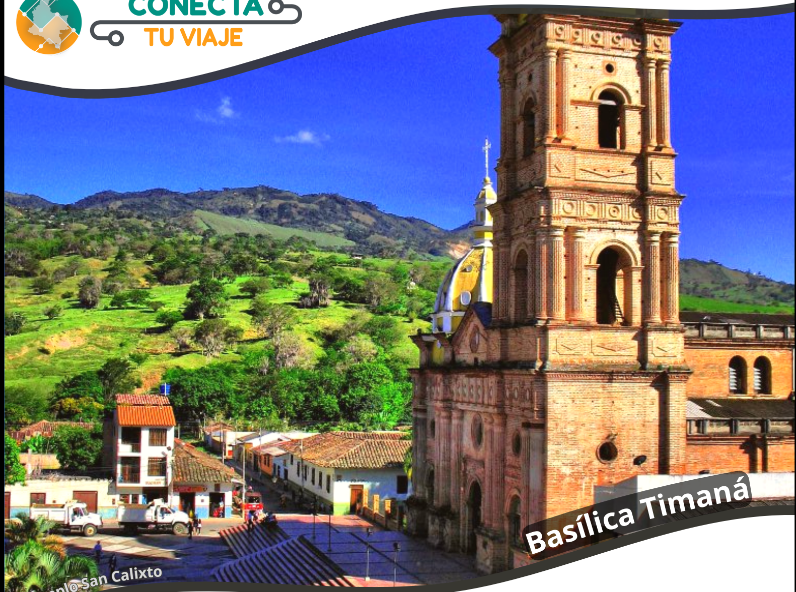
Templo San Calixto