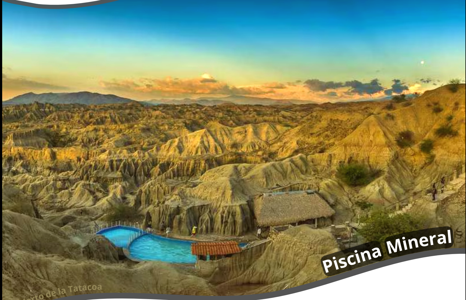
Desierto de la Tatacoa