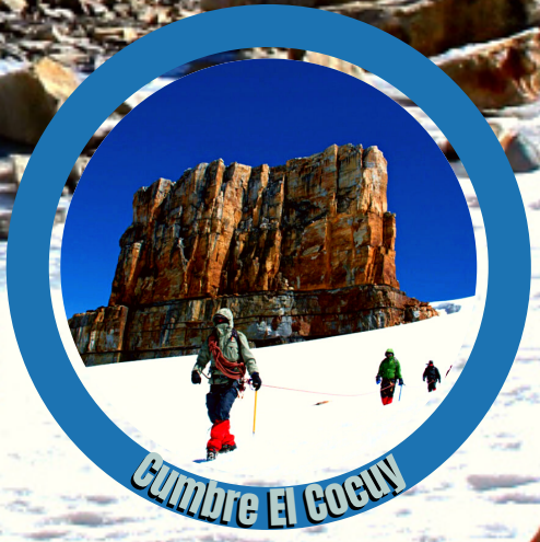
Cumbre El Cocuy

Incluye Tarjeta de Asistencia Traslados Alojamiento Alimentación Coordinador