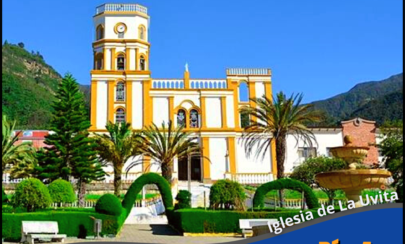
Iglesia de La Uvita