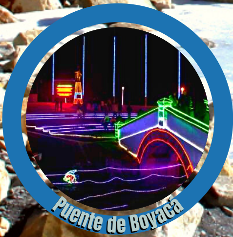
Puente de Boyacá